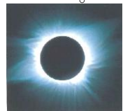
学研図鑑「星・星座」より