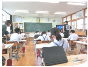
←タブレットを使った学習 教室で写真を見ながらのスケッチ大会 (6年) →