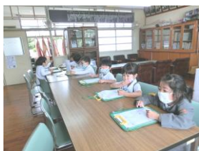
← 学校探検 (1年) 生活科野菜の苗栽培 (2年) →

児童は国から配布されたものと、いただいたものの2枚の布マスクを持っているので、登校時には必ず着用させるようにお願いします。なお、今後学校を通して国から配布される予定の布マスクについては学校で保管し、忘れた時などに利用しますので、ご了承ください。