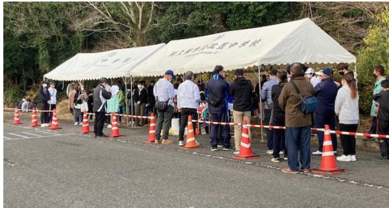
当日朝の監督会議