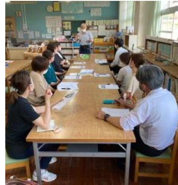
山田楽引継ぎ会での協議