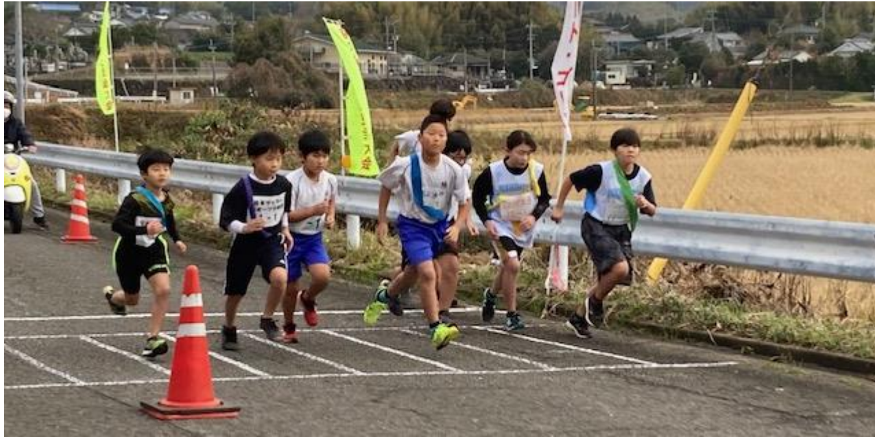
【令和4年度脇本校区駅伝大会】