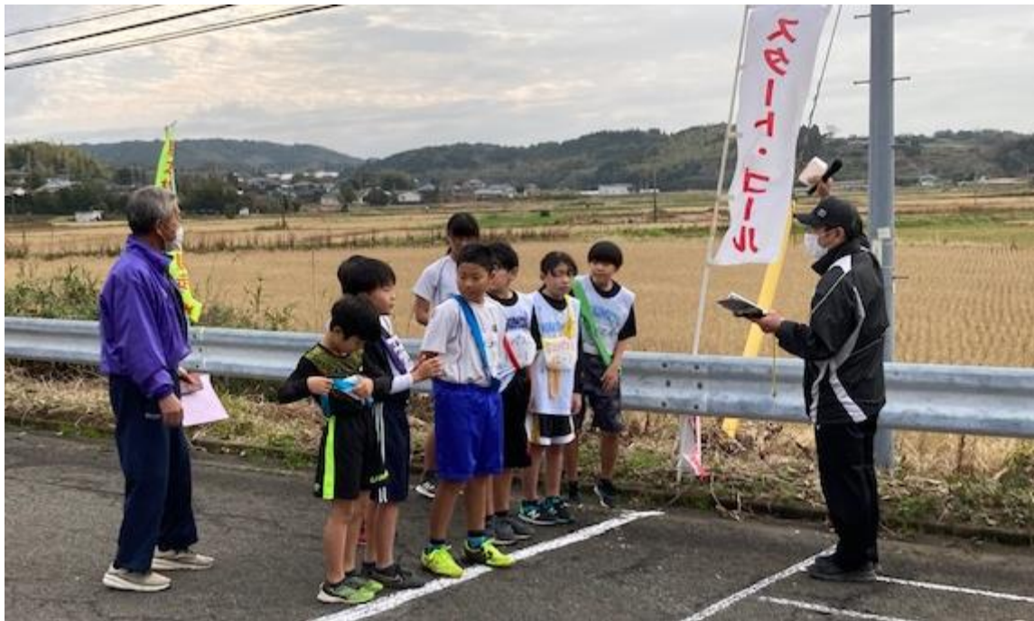
小学生の部(脇本小スポーツ少年団チームと各地区チーム)